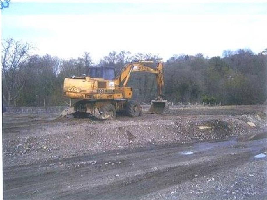
Fotografía núm. 2 –Vista do lugar onde se pode apreciar ditas tarefas denunciadas na Rabadeira.